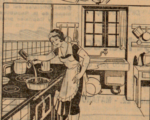
Amb la solució preparada mullo 15 quilos de carbó que abans hauré posat en un cubell, fins que quedi ben mullat. ¡Questió d'un minut!