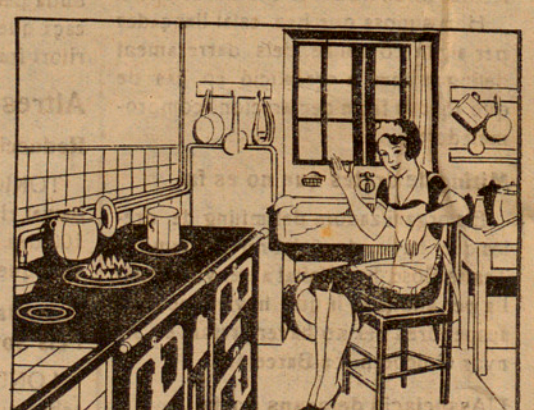
¡Quina felicitat! Més calor a la cuina, més netedat a la llar... ¡encara estalvio la meitat del carbó! ¡AIXO ES IDEAL!

Aplicable a tota classe de carbons: Hules, Antracites, Cok, Alzina, Roure i demés vegetals La casa productora garanteix la seva eficàcia; si vostè compra un pot i no obté el resultat, avisi immediatament per telèfon i li adreçarà un empleat a subsanar el defecte d'aplicació.