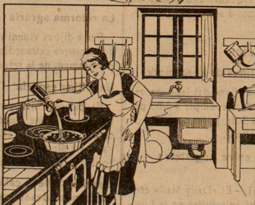
Amb la solució preparada mullo 15 quilos de carbó que abans hauré posat en un cubell, fins que quedí ben mullat. ¡Quèstió d'un minut!