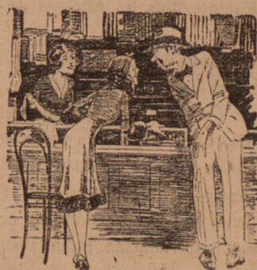
Concepte de l'economia