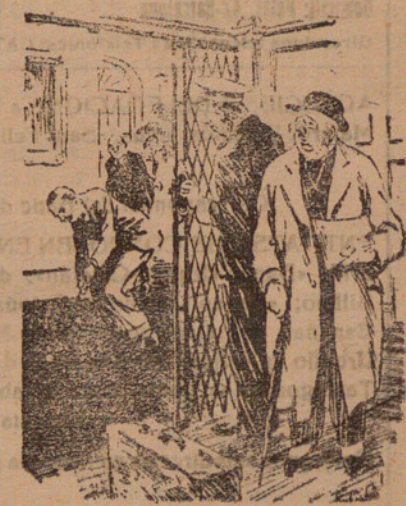
El passatger de l'ascensor.—Que es-pereu? El criat de l'ascensor.—Es una de les possibilitats del nostre golf miniatura, senyor.

La segona part també fou dominada pel Barcelona qui marcà dos gols més: