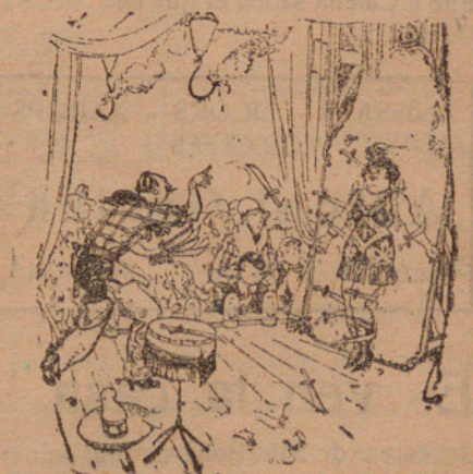
El nen:—Mamà, fixa't. Totes les erra. De Passing Show , Londres.