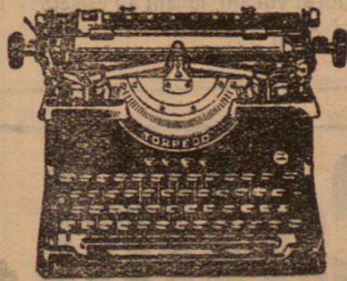
Demostracions gratuïtes a Impremta Minerva

Capella de Sant Simó.—Demà, a dos quarts de 9, missa.