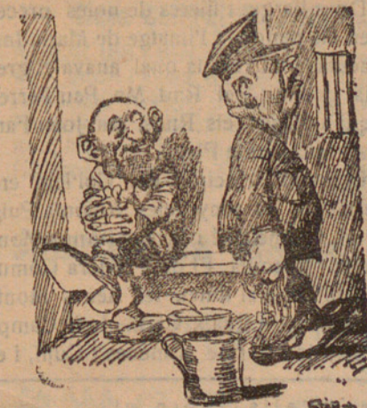
El presoner.—Feu el favor de tancar la porta quan sortiu.

Després la generació innumerable, com riuada immensa envai les galeries i pati del Col·legi i contemplà complaguda un vistós ramillet de focs artificials, sorollosament aplaudit per la seva varietat i bellesa. Les bandes de música interpretaren a continuació una sèrie formosíssima de sardanes, puntejades artísticament per un bell nombre de joves. A les nou de la nit s'acabà la festa, de la qual servaran grat record, tots els qui tingueren la dita de presencià-la. De la boca de tots sortien càlids elogis pels PP. Escolapis, als quals un cop més adreçem la nostra efusiva enhorabona.