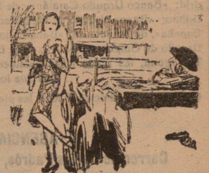
Ella: — Espera'm cinc minuts. El més que m'hi estaré serà una hora. De Passing Show, Londres.