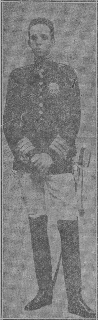
ALFONSO XIII EN 1902

En otros aspectos del vivir nacional también don Alfonso se ha distinguido siempre patrocinando todas las iniciativas en materia científica, agrícola, ganadera e industrial yendo él mismo, una por una a visitar las factorías más importantes de la nación, los concursos de ganado más escogido, los cultivos más cuidados, los laboratorios más útiles, con el mismo interés e