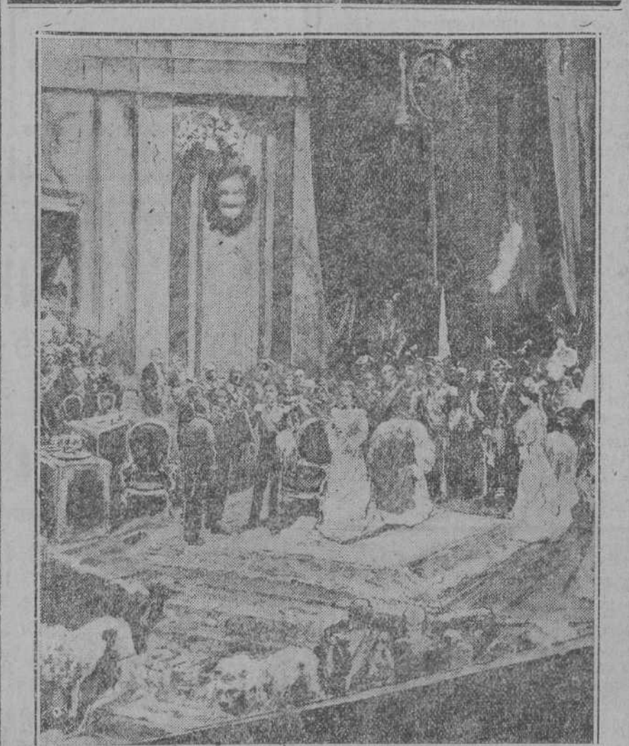
Alfonso XIII jura en el Congreso ante los representantes de la nación.

«A Su Majestad el Rey de España, don Alfonso XIII, con motivo del 41 aniversario de su natalicio y del 25 de su exaltación al Trono, las niñas y niños asilados en la Casa provincial de Caridad y la superiora,