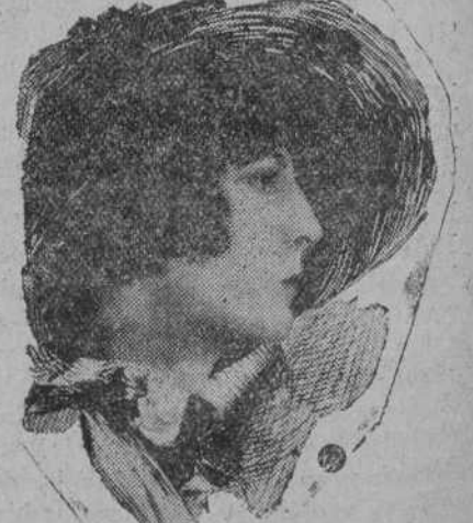
La linda Priscilla Dean, que, según sus admiradores, está más guapa cada minuto que pasa.