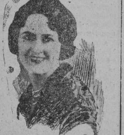
Marjorie Gay, una estrella de primera magnitud del firmamento del film.