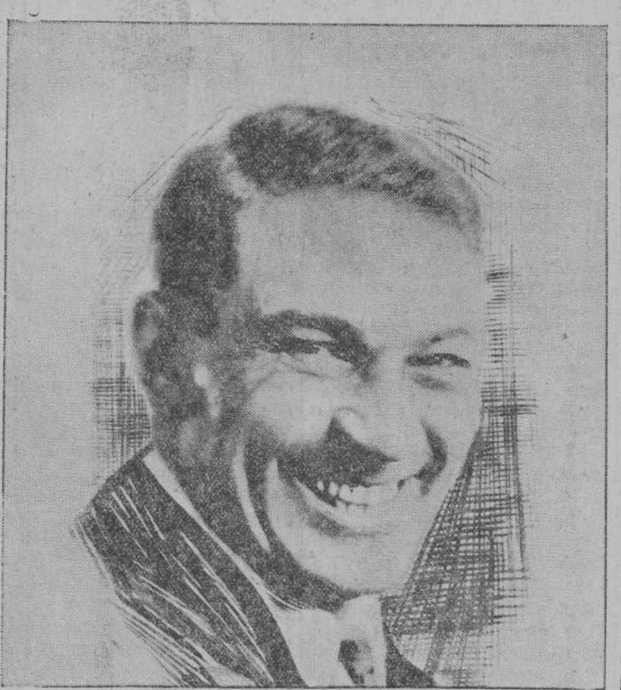
El notable actor cinematográfico Victor Mc Lagen, el hombre de la risa contagiosa.

americanos han considerado que Greta Garbo es actriz de una inteligencia extraordinaria.