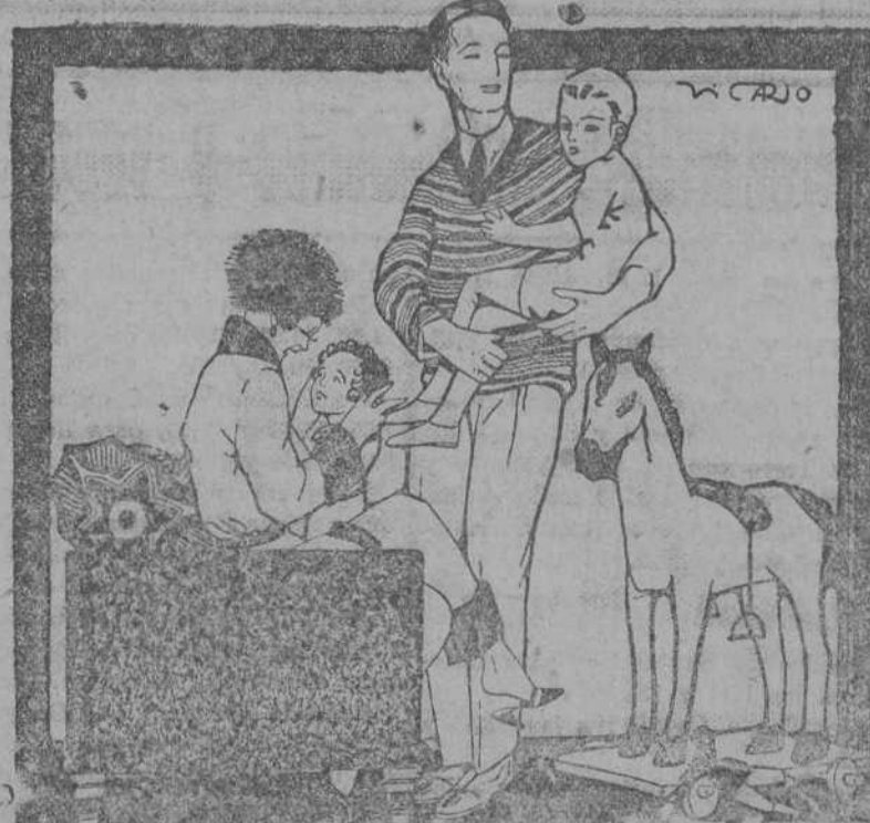
Si, hijo mío, si. Como a tu hermanito, cuando lo necesitas, te purgaré con los deliciosos

Creados hace 50 años para reemplazar toda agua mineral