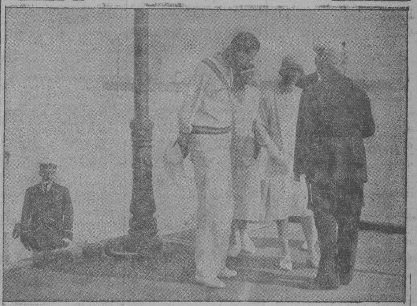
El príncipe de Asturias y las duquesas de Santoña y de la Victoria al desembarcar, después de un paseo en balandro por la bahía.

Pasó al Hospital en una camilla de la Cruz Roja.