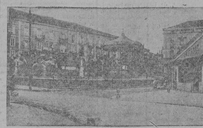
TORRELAVEGA.—La magnífica Plaza Mayor, corazón de la ciudad, donde se celebran los mercados espléndidos de los jueves y los deliciosos conciertos de estas noches de estío.