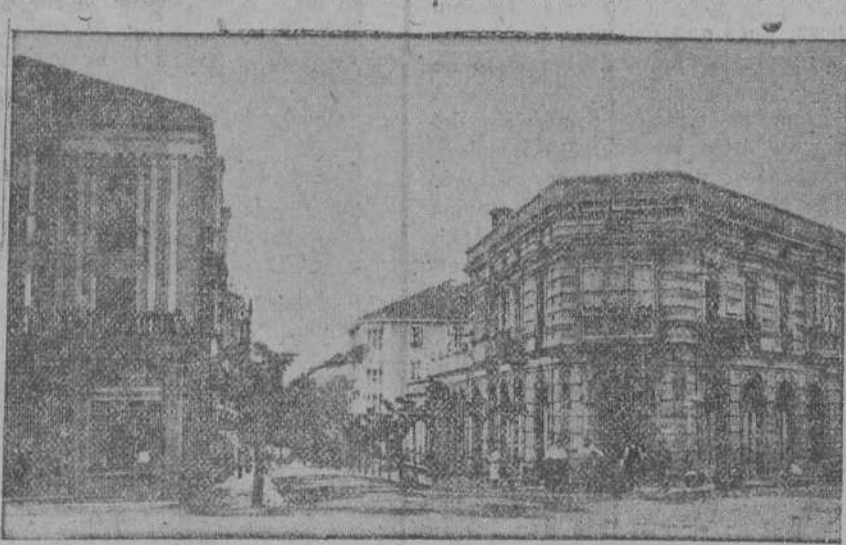
TORRELAVEGA.—He aquí una hermosa calle de la laboriosa ciudad calle de población grande preparada para un pavoroso comercio.