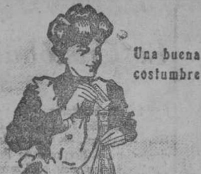
Una buena costumbre

Todo el mundo bebe los Lithinés D. Gustin