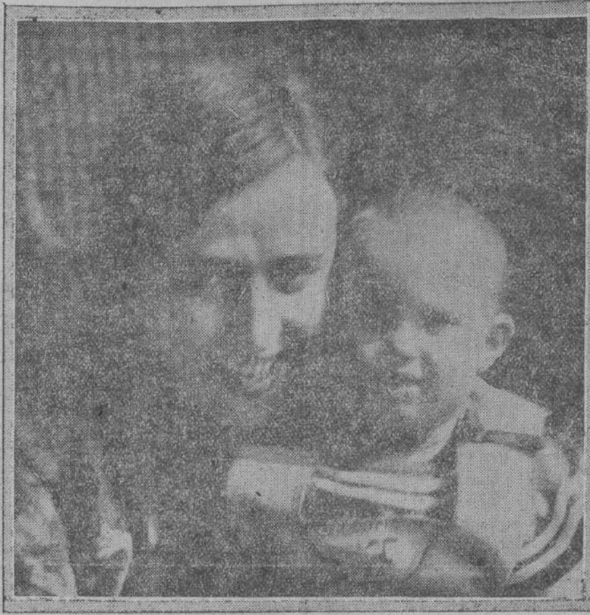
Esta es, sin disputa, la más feliz creación de la genial declamadora rusa Berta Singerman.