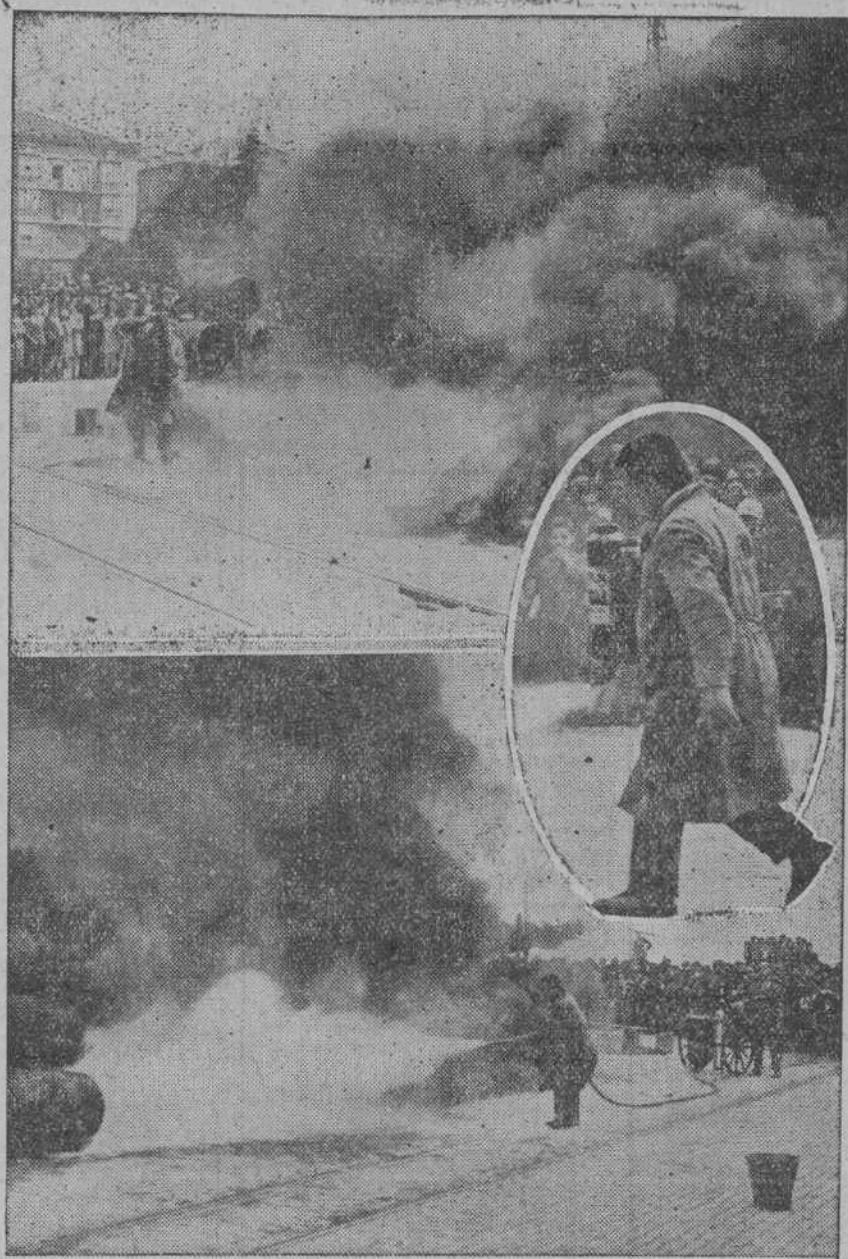
Interesantes momentos de las pruebas verificadas el domingo.