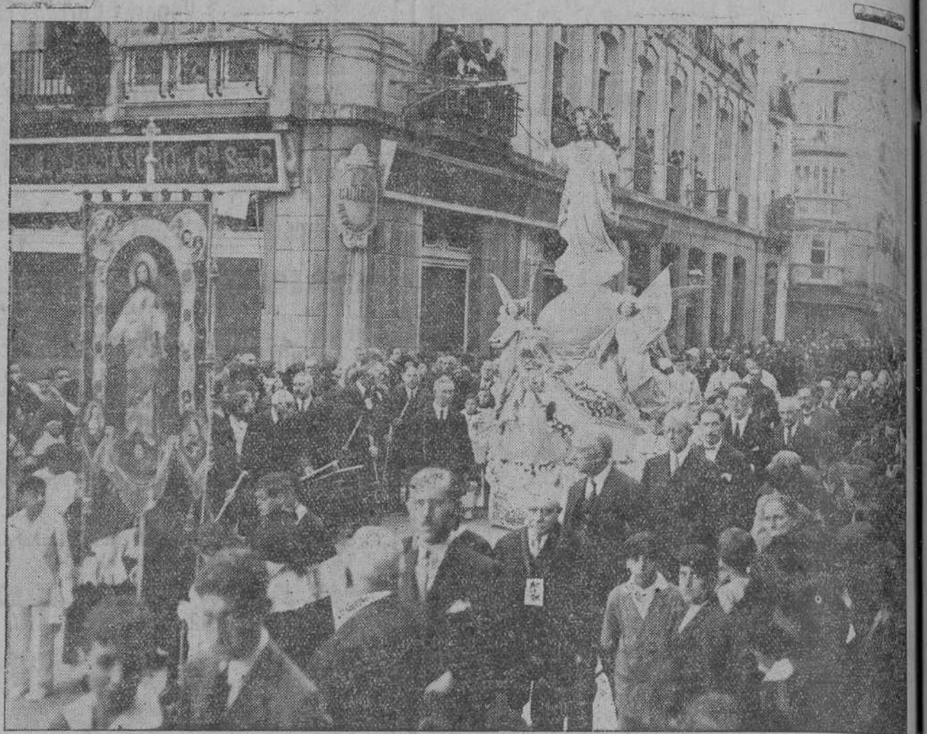
La solemne procesión del Sagrado Corazón de Jesús desfilando ayer por las calles de la ciudad.

bernador interino, ostentando a la vez la presidencia de la Diputación, el general de la plaza, el comandante de Marina y el superior de los Jesuitas reverendo Padre Vicente.