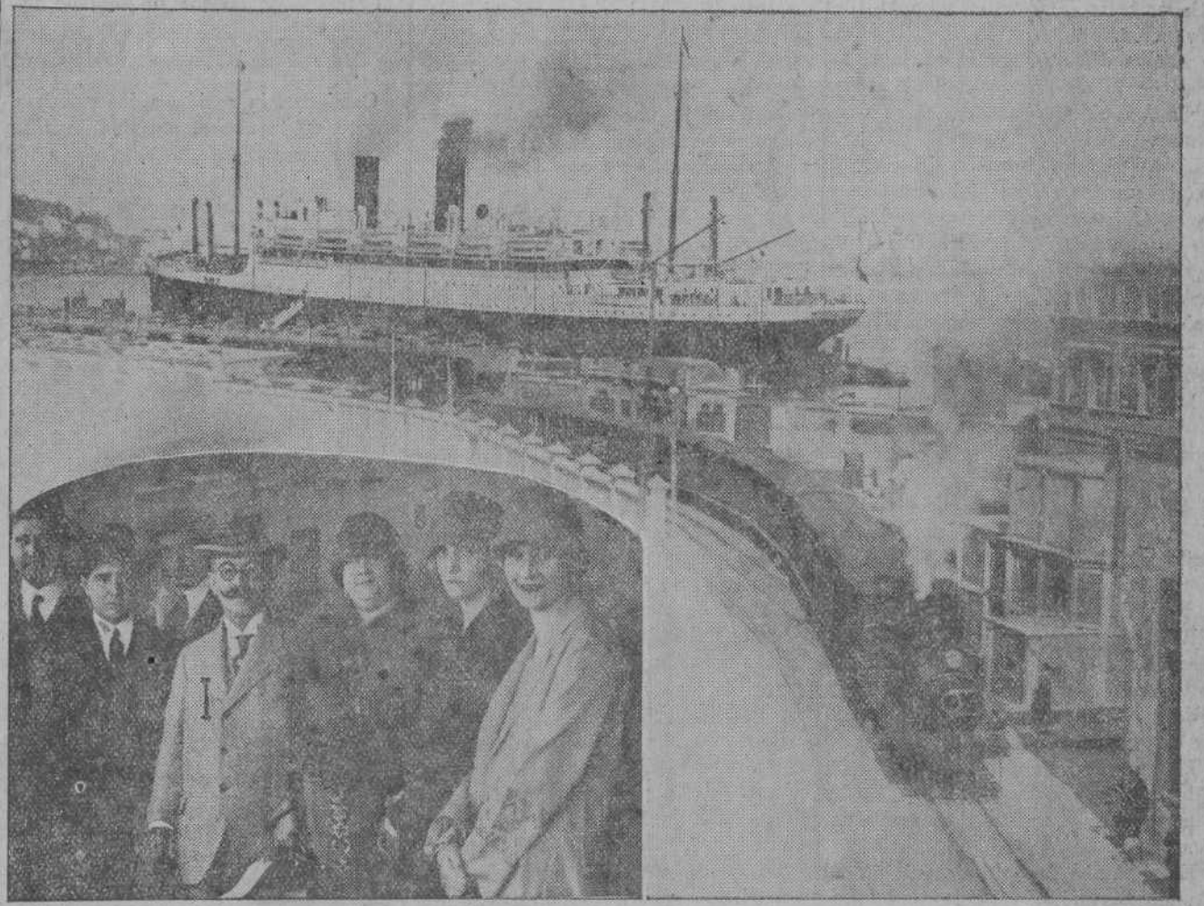
El puerto de Santander, como puede apreciarse en la fotografía, ofrece admirables ventajas al turismo. En el extremo, el ilustre ex presidente de Venezuela, señor Márquez Bustillos, con su esposa e hijas, momentos antes de desembarcar del trasatlántico en que ayer llegaron a Santander.

En el barco, lleno de mujeres guapas, casi todas pintadas como si estuvieran en una ciudad y casi todas tumbadas en las hamacas de la toldilla, como si tomaran baños de sol en un sanatorio marítimo, encontramos al doctor don Victorino Márquez Bustillos, ex presidente de Venezuela y uno de los políticos más prestigiosos de su país.