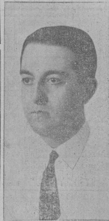
cuchaba las primeras ovaciones intermitiendo «Bohemia» y «Rigoletto», en Zaragoza.