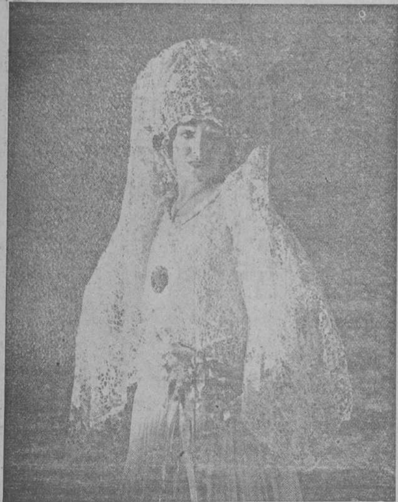
La hermosa actriz Lila Lee tocada con la preciosa mantilla que usó en su última producción.

Recientemente los estudios de De Mille se asociaron con la Metropolitan Studio, de Hollywood y parece que las películas de ambas entidades productoras serán reservadas para su distribución en la temporada de 1926-1927 a la Producers Distributing Corporation. Esto no obstante, parece ser que Cecil B. de Mille aguarda la decisión de Jesse L. Lasky antes de tratar sobre los negocios de 1927.