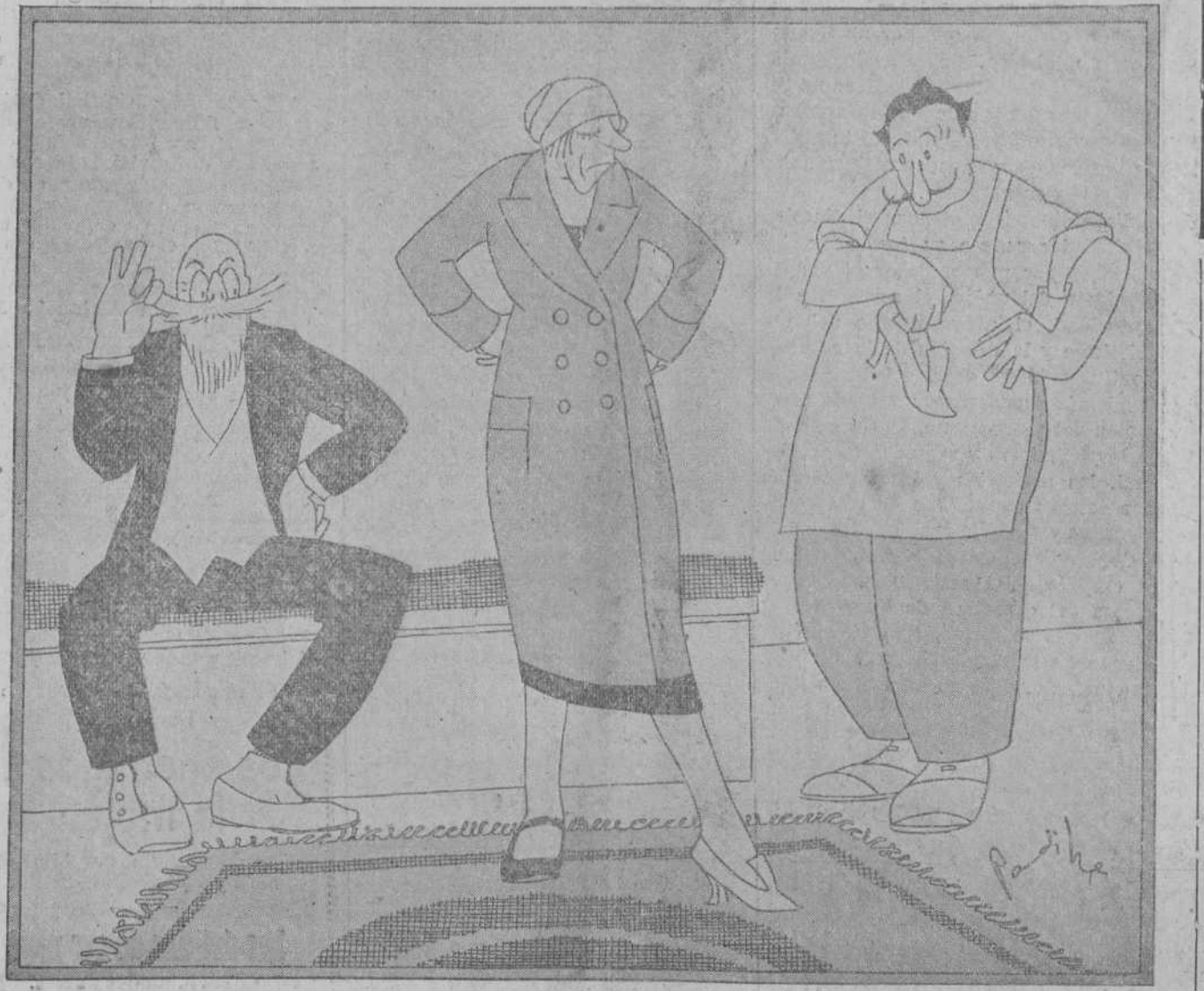
—Estos Luis XV son muy bonitos, pero me están un poco estrechos. —Ah, pues que te saquen un Luis XVI!