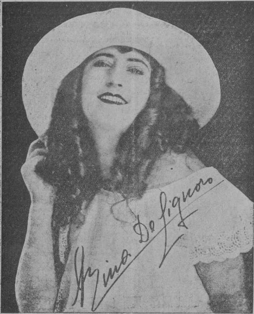
Rina de Lignoro, nueva revelación de la pantalla italiana.