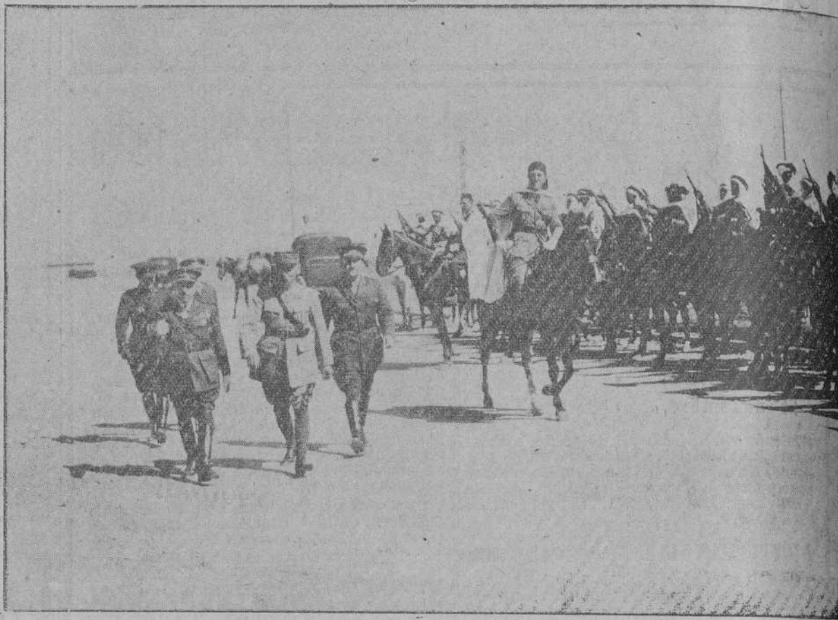
EN LARACHE.—El general francés Hergault revisando las tropas Regulares españolas.

Entre ellas hay un moro cuya identificación interesa.—Los movimientos de la columna del coronel Dolla.—Noticias de las últimas operaciones.—Los curiosos diálogos por teléfono de Abd-el-Krim y su hermano.—Otras interesantes noticias.