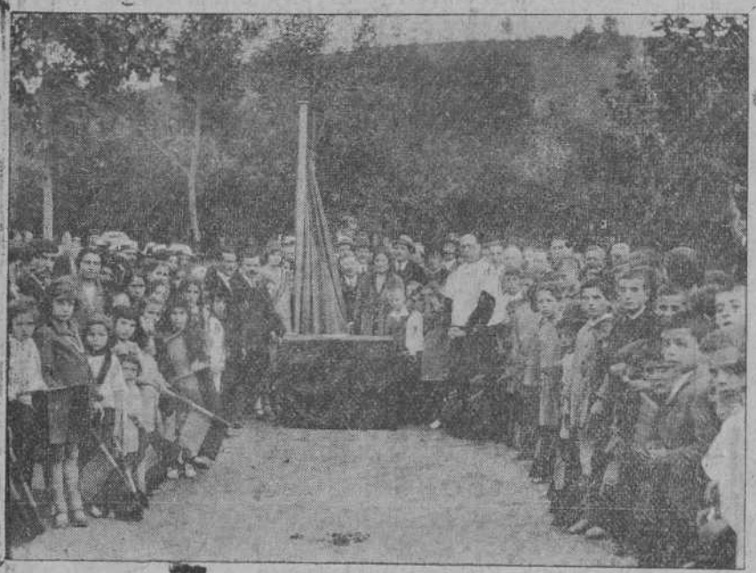
Interesante detalle de la simpática fiesta celebrada el domingo en Barreda.

Y entramos en la parte patriótica de la fiesta, empezando por la bendición de la bandera, por el párroco