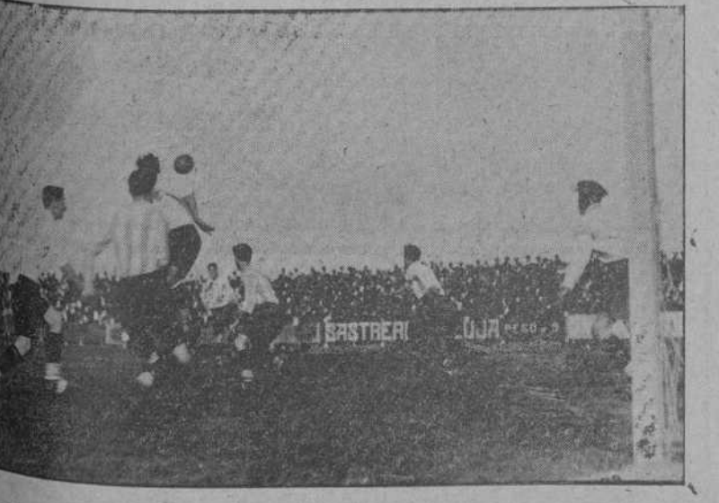
Un momento de peligro ante la meta de la Gimnástica.

Se pensará que somos pesimistas extremos, que sólo vemos los parados bajo un prisma oscuro, y sin embargo no hay tal cosa. Creemos y