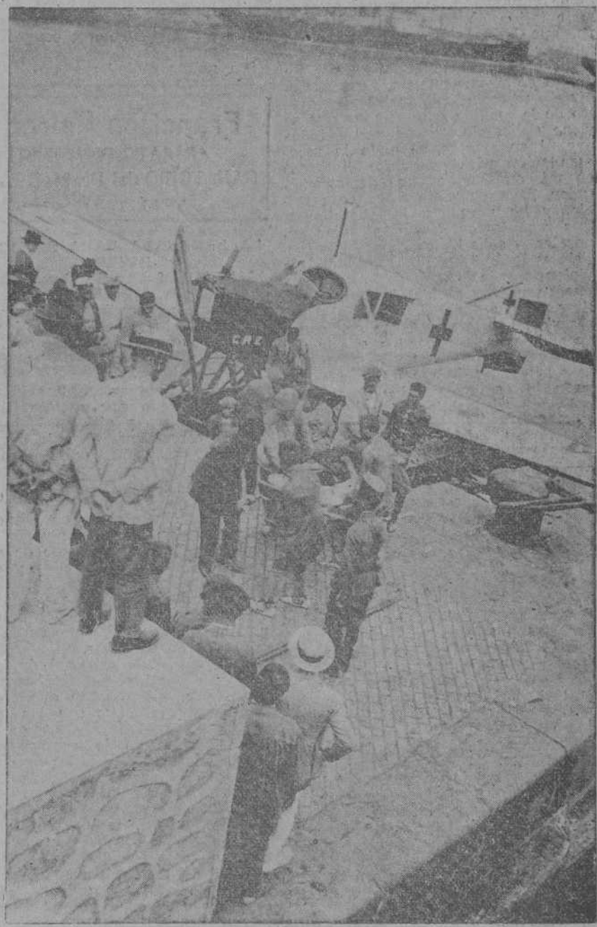
Hidroavión de la Cruz Roja al llegar al puerto de Melilla con heridos graves de las últimas operaciones en Alhucemas.

«Los tendenciosos, los enredosos, los melancólicos, que decía Benito Mussolini—, no pudiendo negar la evidencia de los triunfos del Ejército, intentan quebrantar su sagrada unión sembrando cizaña, atribuyendo a los jefes de las fuerzas desembarcadas en Alhucemas tardanzas que han precisado acicates. Los nombres de Sanjurjo, Saro, Fernández Pérez, Coded, Martín, Franco y Vera, son garantía suficiente de que no han retrasado la ejecución de los órdenes del general en jefe ni un minuto más de lo preciso para tener preparadas sus fuerzas y los elementos indispensables. Ni en un solo caso ha sido preciso al Alto Mando emplear conminación ni fijación de fechas, bastándole exponer a la consideración de los jefes para obtener de ellos los plazos mínimos de ejecución (veintitrés días de operaciones), las características generales del problema de conjunto, las contingencias de un brusco cambio de tiempo y la moral del enemigo en cada momento.