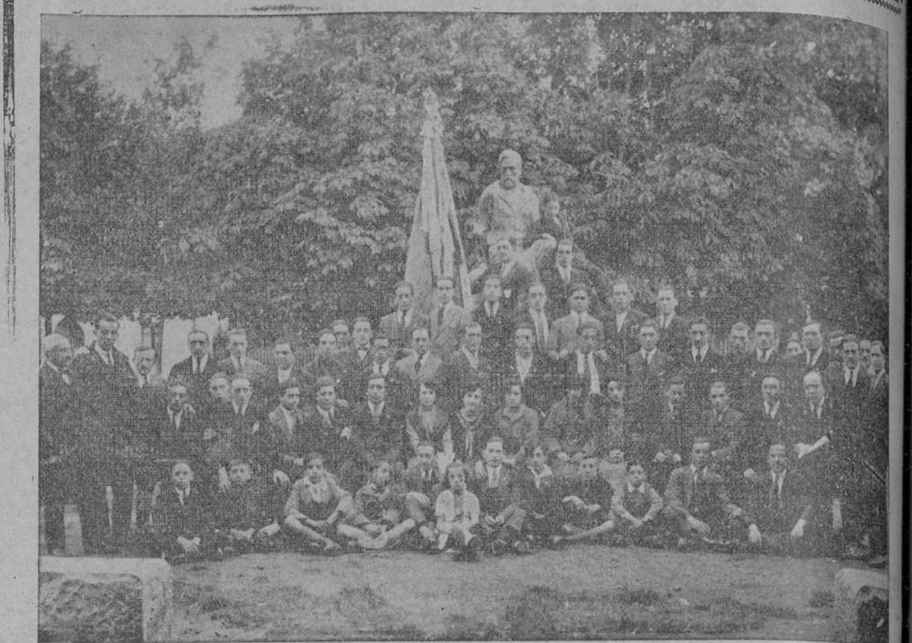
El Orfeón Reinosano, una de las más notables agrupaciones corales de la Montaña.

No cabe duda de que la mejora del ganado de la Montaña requiere una importación periódica de reses de raza suiza o holandesa para refrescar la sangre, ya que, desgraciadamente, está probado que después de varias generaciones degeneran mucho en esta región las vacas holan-