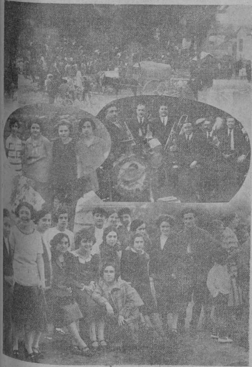
VARIAS NOTAS DE LA TIPICA ROMERIA DE SAN MIGUEL, EN HERAS.

Accesorios—Grasas—Neumáticos—Gasolina Automóviles RUGBY—DURANT—CHENARD et WALCKER—CADILLAC Cabinas independientes. Estancias desde 0,50 pesetas diarias. Servicio permanente. Molinedo, 2-Teléfono 4-23