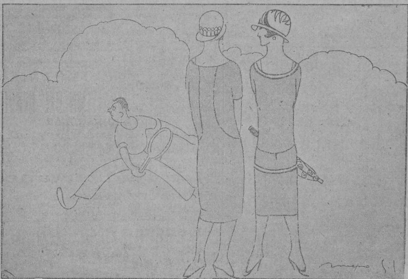
—¡Mira que el marqués jugando al tennis!... —El caso es jugar; le da lo mismo una raqueta que otra.