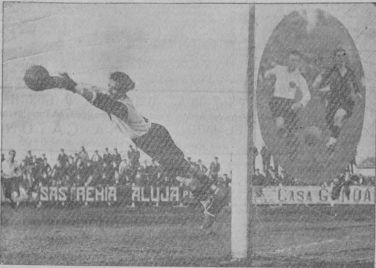
DEL PARTIDO DE AYER.—EL PORTERO MADRILEÑO PARA DE MODO EXCELENTE UN BUEN CHUT DE GÓMEZ ACEBO.—EN EL OVALO, UN AVANCE DE DIEZ EN EL PRIMER TIEMPO. (Fotos Samot).