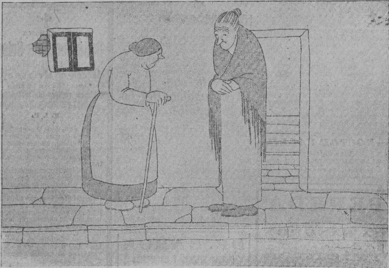
—¿COMO ESTA LA VIDA DE CARA!... —¿COMO DE CARA? ¡DE CRUZ, HIJA, DE CRUZ!..