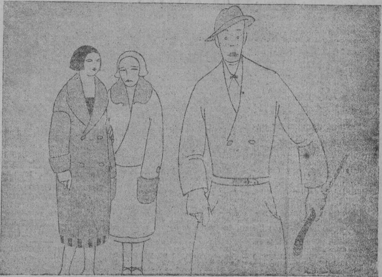
—¿CONOCES A ESE CHICO? PARECE UN POLLO BIEN. —NO LO CREO. LLEVA LA GABARDINA MUY LIMPIA.

Los talleres de Floralia siguen, como ayer, cerrados en señal de duelo.