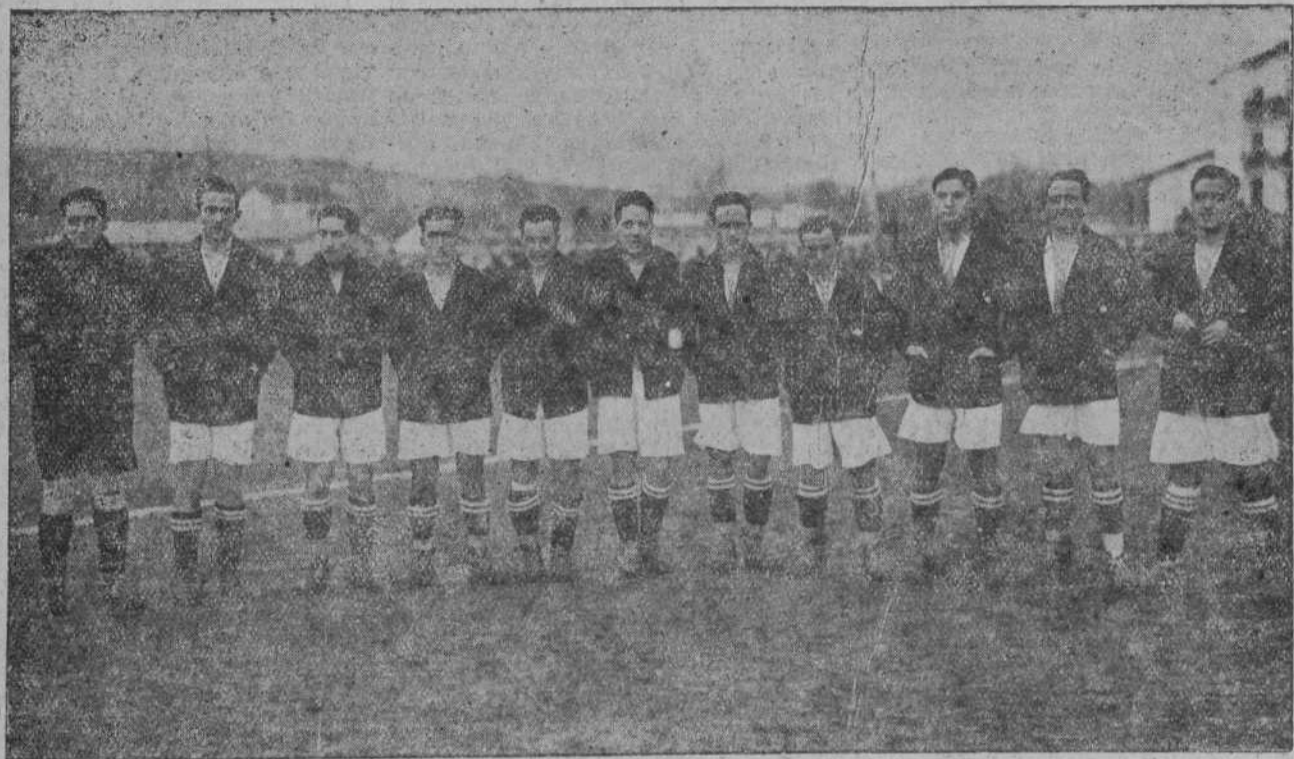
EQUIPO DE LA REAL SOCIEDAD, DE SAN SEBASTIAN, CAMPEON DE GUIPUZCOA, QUE ESTA TARDE SE ENFRENTA CON EL REAL RACING CLUB EN LOS CAMPOS DE SPORT