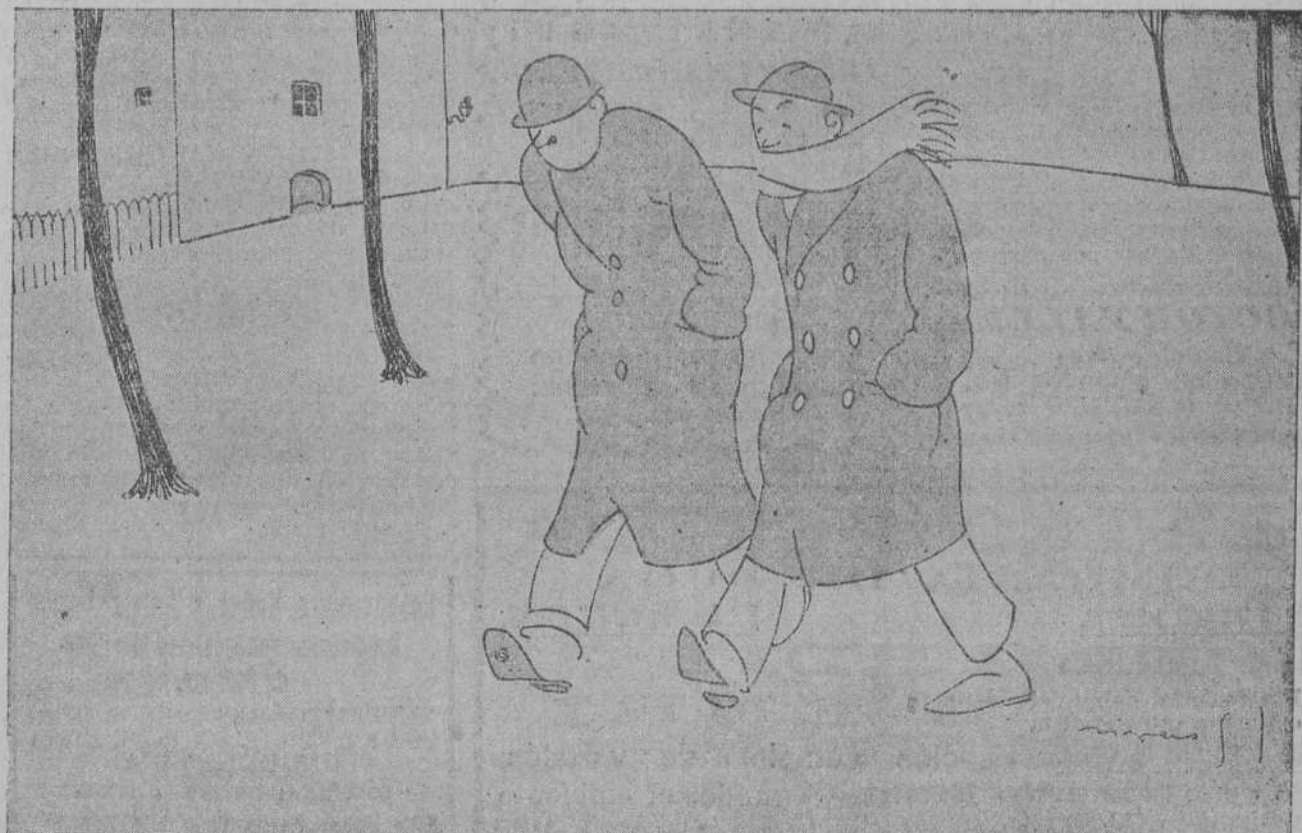
—NO ME EXPLICO COMO HAY GENTE QUE SE DIVIERTEN CON LA NIEVE. DE SE NO SE SACA MAS QUE LA CABEZA CALIENTE Y LOS PIES FRÍOS