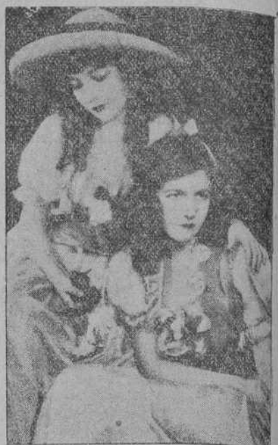
Las encantadoras LILIAN y DOROTHY GISH, que después del gran éxito alcanzado en «Las dos hermanas» (cuya es esta escena), han conseguido otro no menos ruidoso con su última interpretación «Rómulo».

También prepara esta entidad «Miércoles de Ceniza», de asunto parecido al de la anterior; «Ensueño», «La gran retirada» y «Wallenstein». La «Westia», por su parte realiza actualmente «Prato», una comedia entre modistillas vienesas y en la que actúa de protagonista Henny Porten.