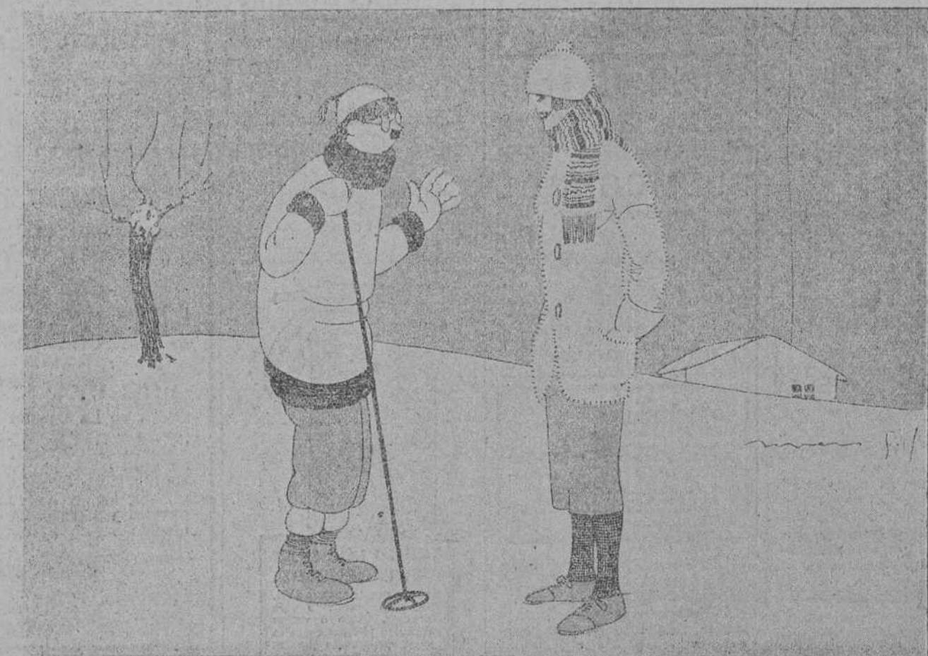
—OYE, LULU. ¿EN INVIERNO DONDE PACEN LAS VACAS EN SUIZA?