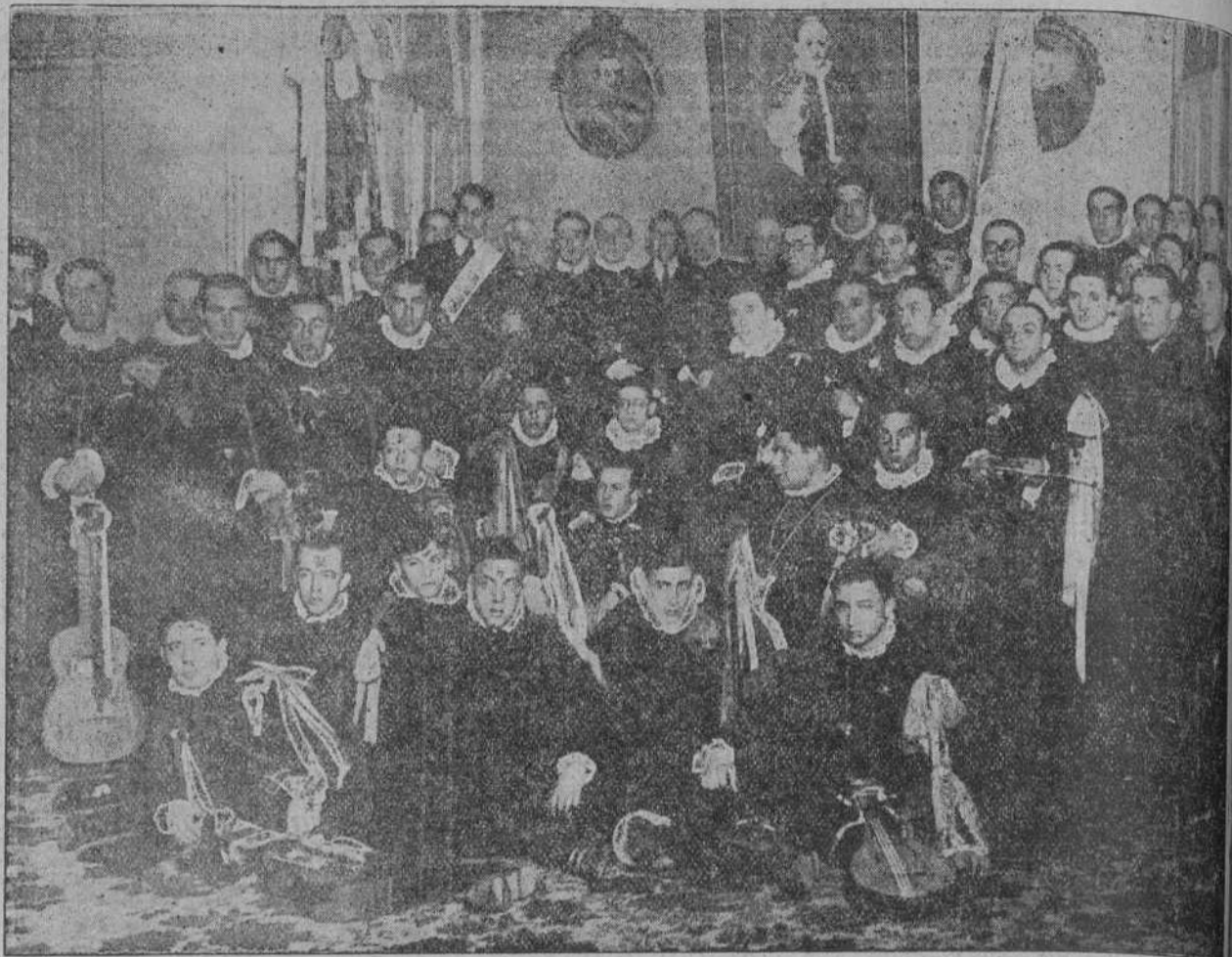
LA TUNA COMPOSTELANA.—La simpática y notable agrupación dur ante la visita que hizo ayer mañana al Palacio Episcopal.

Y volvimos a cruzar el coto en todas direcciones, andando para un lado y para otro, siempre sobre el eje que marcaba «Castañas» que, con