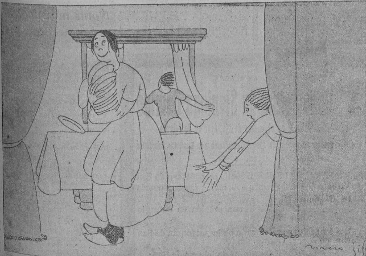
LA ESTUDIANTINA PASA