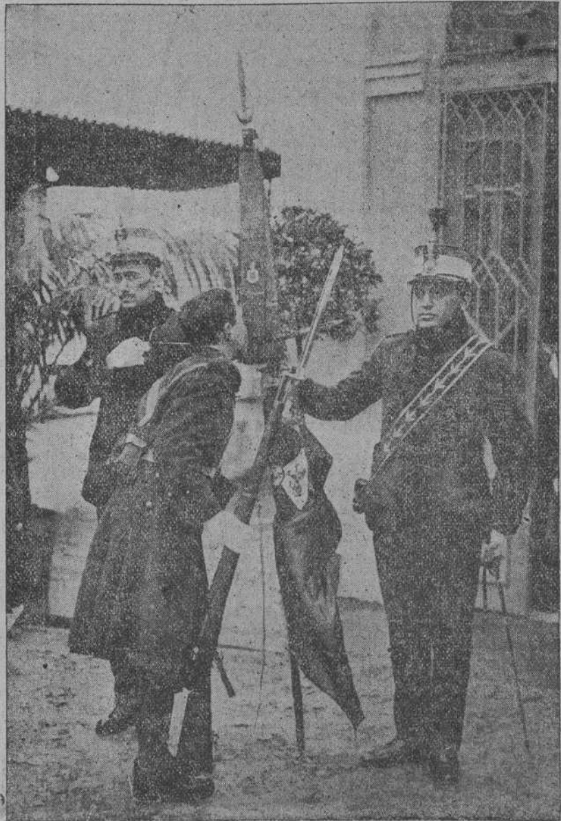
AYER, EN EL CUARTEL DE MARIA CRISTINA.—Solemne momento de jurar la bandera los reclutas.

Añade que él no conoce el tecnicismo comercial, y que de haber tenido