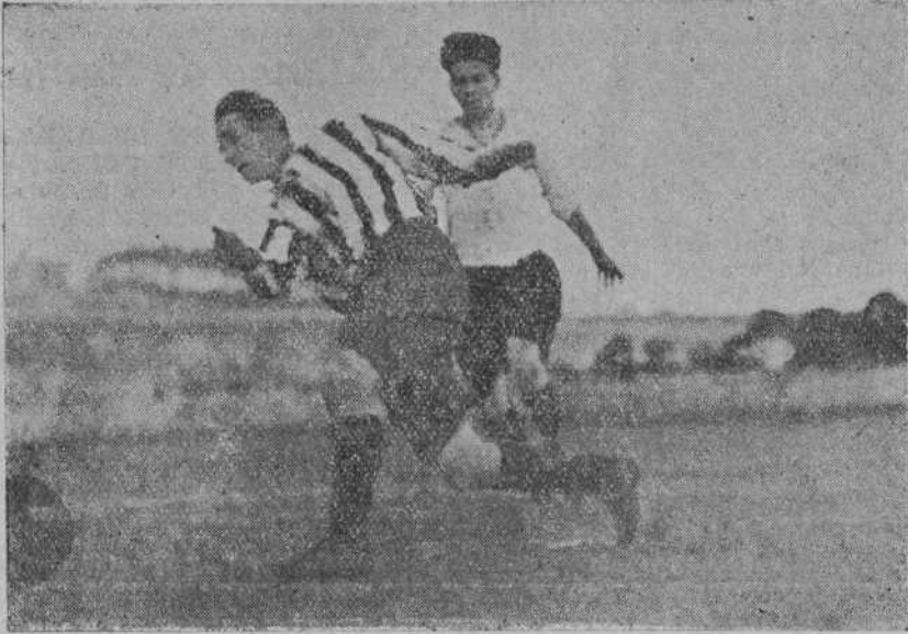
DEL PARTIDO SPORTING-RACING.—Una interesante jugada del encuentro.