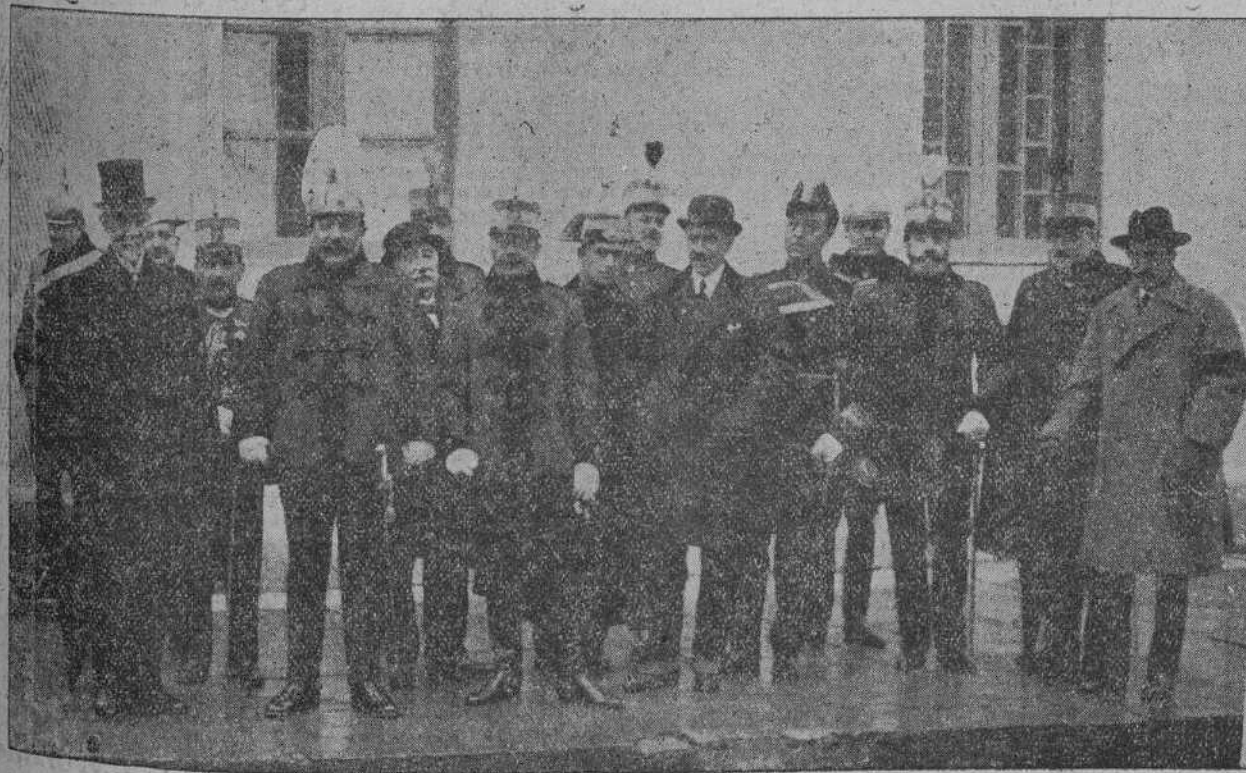
EN EL CUARTEL DE MARIA CRISTINA.—Grupo de autoridades y representaciones que asistieron ayer a la jura de la bandera.