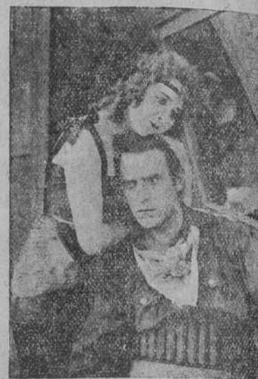
¿A qué película de las últimamente exhibidas en el GRAN CINEMA, pertenece esta escena?