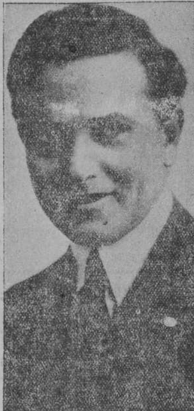
HERBERT RAWLINSON, simpático actor cinematográfico de la comedia americana.