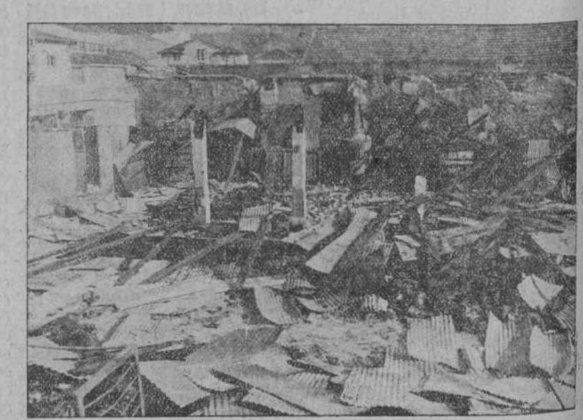
Una de las dependencias destruidas por el fuego.