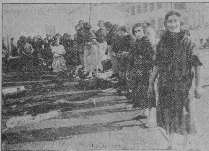
Hileras de mujeres que transportaban el agua hasta el bombillo de incendios.

Vertical text on the right edge of the page, including advertisements and notices.