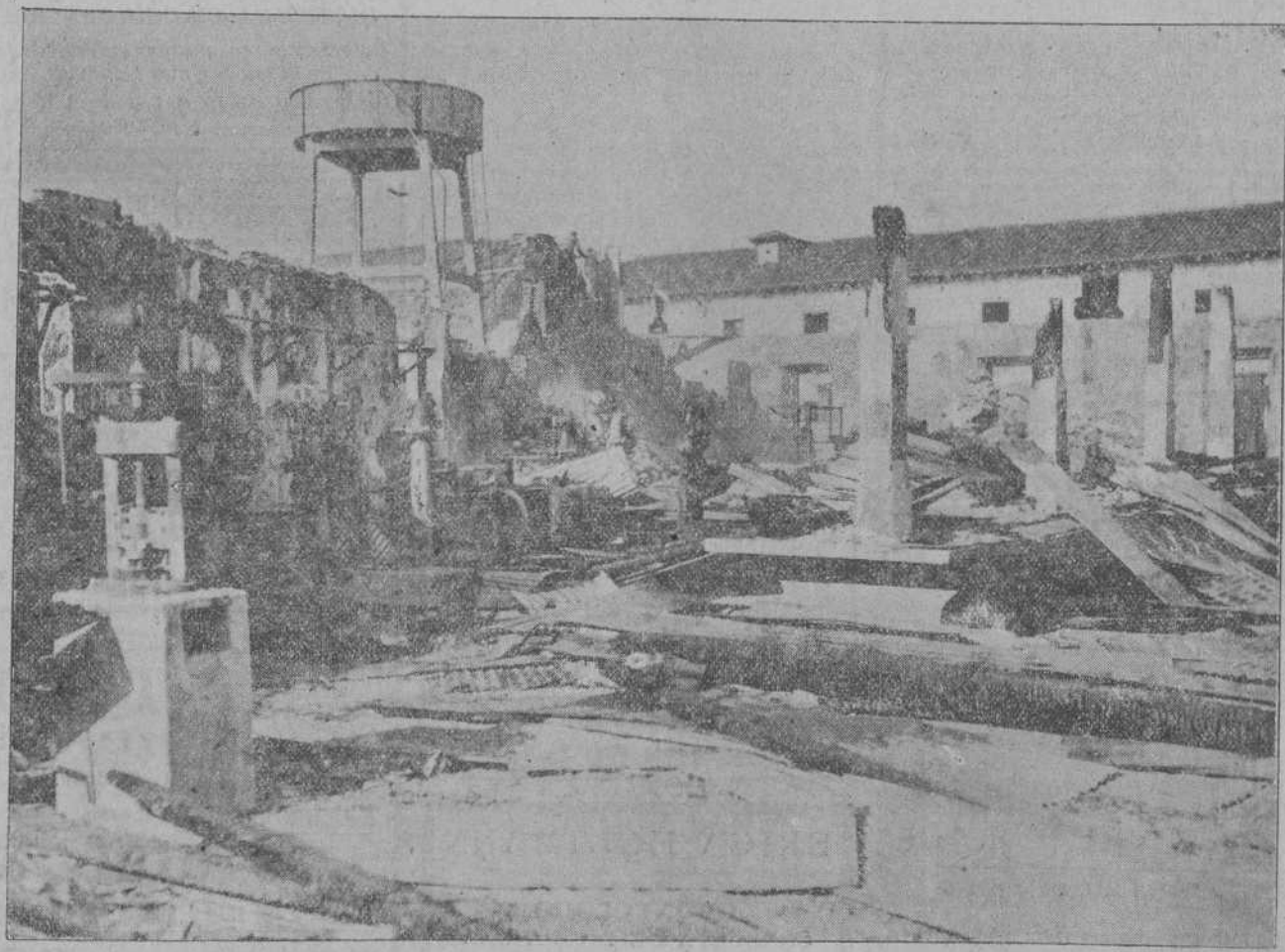
DEL INCENDIO DE SANTAÑA.—La sala de máquinas de la fábrica de Hijos de C. Albo, que quedó reducida a cenizas.