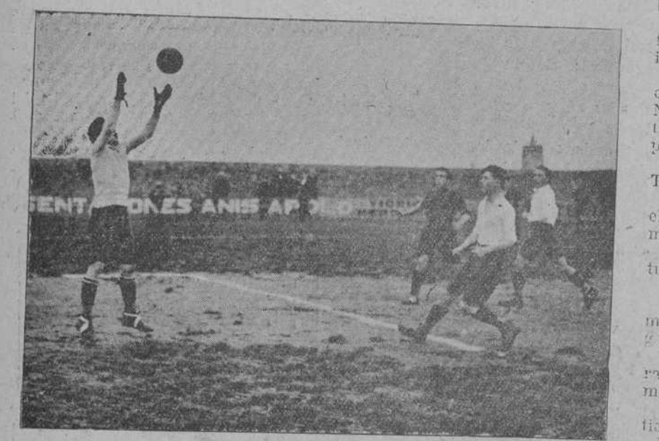
EL PARTIDO REINOSA-RACING.—El portero del Reinosa en una parada.

A las dos y cuarenta y cinco, bajo las órdenes del árbitro Rivero, se alinearon ambos onces, tocándole escoger a Guarnizo, que pronto se hace con el balón, pasando a los dominios del Parbayón, teniendo dominados los cuarenta y cinco minutos y perdiendo infinitud de veces; pero la providencia estaba a favor de los forasteros, no pudiendo los de casa marcar un tanto, a pesar de haber jugado todos sin excepción colosalmente, destacándose la labor de los medios y delanteros; faltaba poco para terminar este primer tiempo y por falta de co-