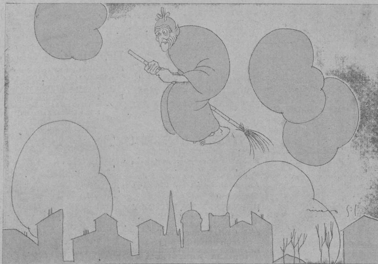
LA BRUJA.—¡También son ganas de molestar!...