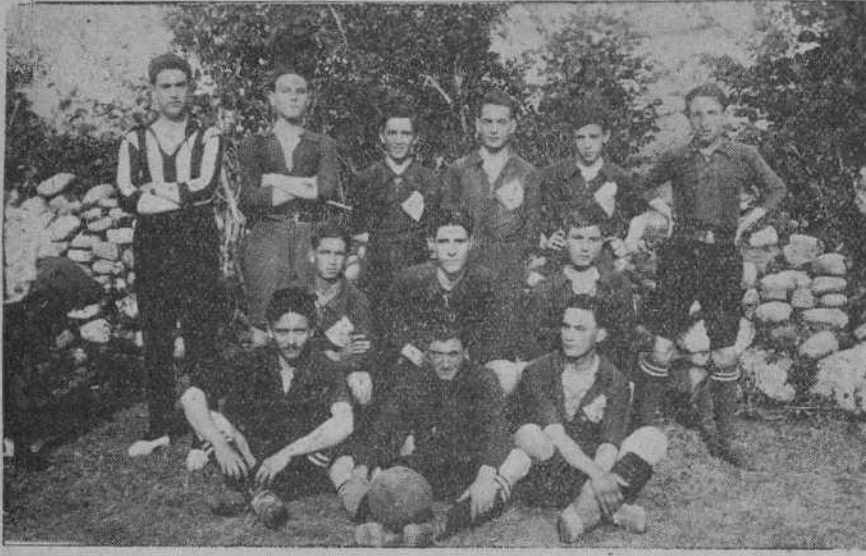
El notable equipo Union Deportiva Cantabra, de Arenas de Iguña, cuya actuación está siendo muy exitosa.