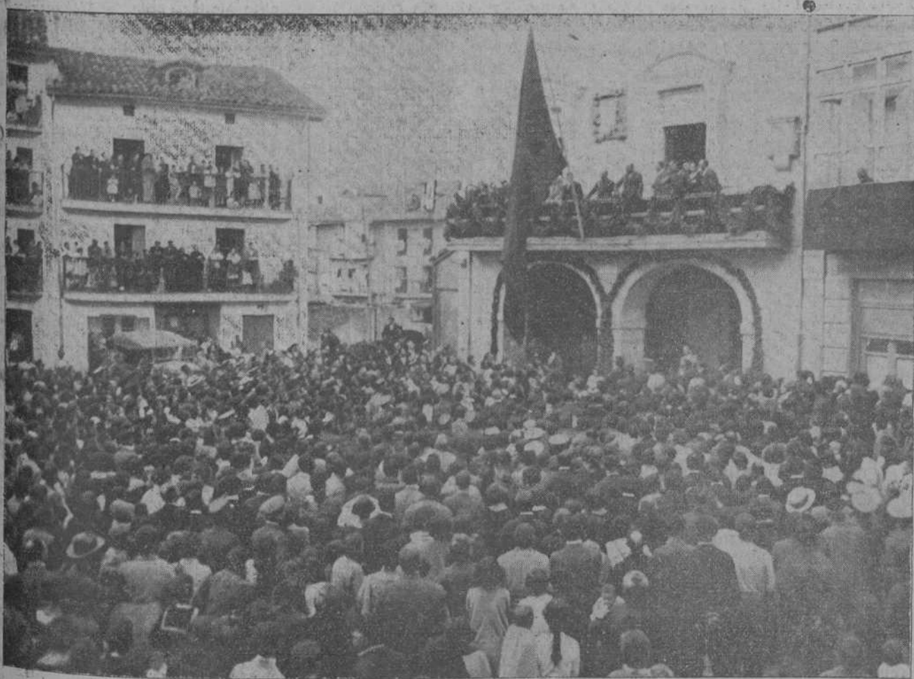
EL GENERAL PRIMO DE RIVERA EN SANTOÑA.—Desde el balcón del Ayuntamiento, el presidente del Directorio saluda al pueblo santónés congregado en la plaza de la Constitución.

Ya en el recinto visitó el local destinado a la guardia militar de la prisión, haciendo algunas acertadísimas observaciones relacionadas con la habilitación de los servicios del mismo.