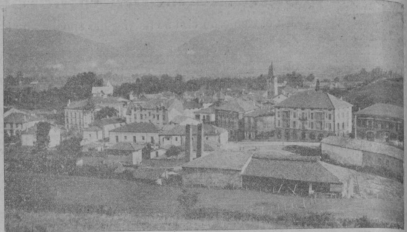
Vista general del industrial pueblo de Cabezón de la Sal.

El Ayuntamiento elegido por el delegado gubernativo promete hacer una labor útil y provechosa para la