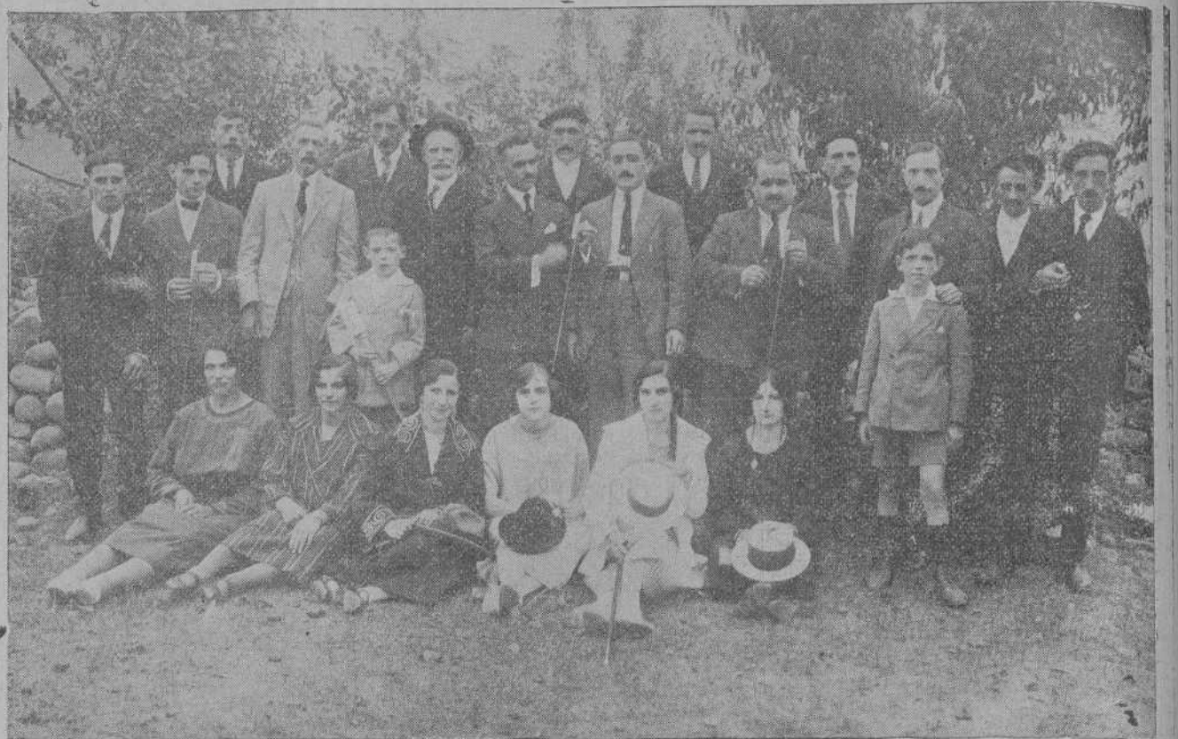
SAN MARTIN DE TORANZO.—Grupo de prestigiosos vecinos y bellas jóvenes que formaron la comisión de los animados festejos celebrados con motivo del día del Carmen.

Prometemos informar debidamente a nuestros lectores del resultado del mercado con los precios aproximados del ganado vacuno, que es lo único que se merca en tan importantes ferias.