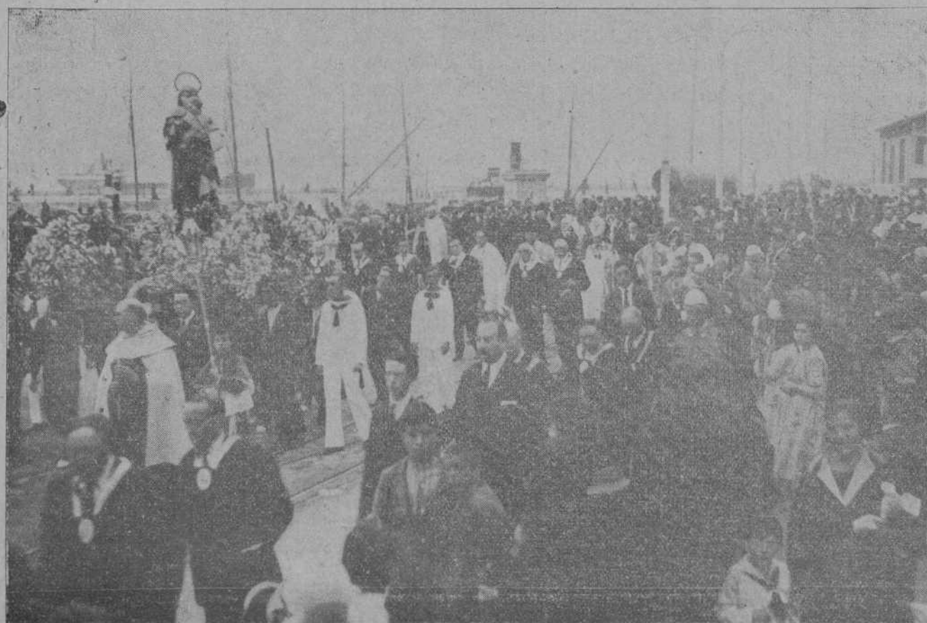
LA PROCESION DE AYER, A SU PASO POR PUERTO CHICO.

Sin embargo, el hijo del jefe de la legión garibaldina fué toda su vida un liberal apasionado, y últimamente, encontrándose ya gravemente enfermo, dirigió una carta a los radicales y socialistas franceses que celebraron un mitin de protesta por la muerte de Matteotti, asociándose a sus demandas y demostrando su confianza en que, al cabo, triunfaría su país la Libertad.