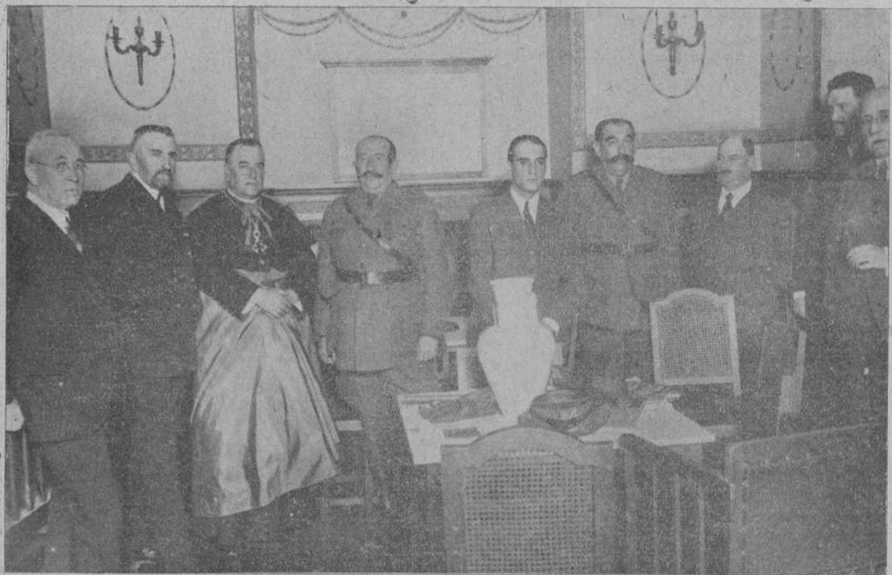
El capitán general señor Burguete, con las autoridades locales, en el restaurant «Royalty», donde el ilustre militar fué obsequiado con un banquete.

Por la mañana general Burguete y Saliquet al depósito de Intendencia militar, visitando detenidamente y elogiando su instalación. Después estuvieron en el Hospital Militar, saludando cariñosamente a los enfermos y preguntándoles de las causas de sus enfermedades. Por último, visitaron el cuartel de la Exposición, donde se alojan fuerzas de la Guardia civil.