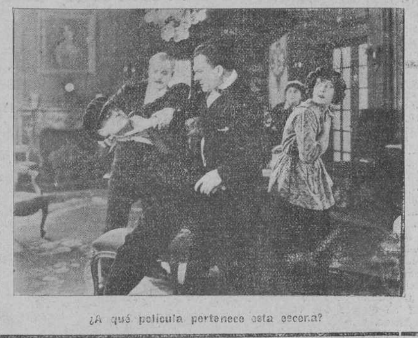
¿A qué película pertenece esta escena?