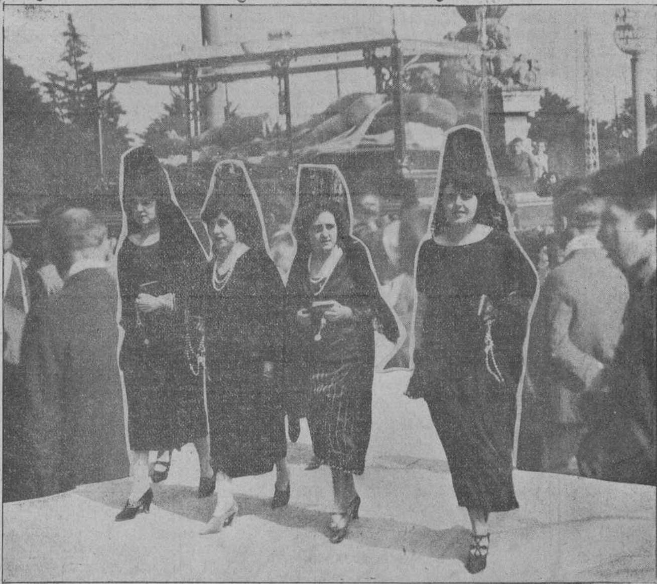
NOTAS DE LA SEMANA SANTA EN SANTANDER.

Toda la correspondencia política y literaria dirijase a nuestro directori Apartado, 83.