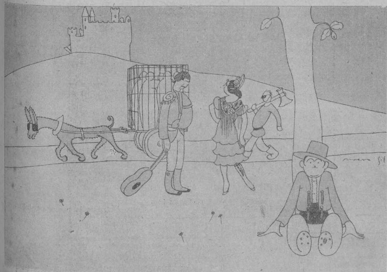
JUANITO ESPAÑOL. —Pero qué cosas pasan en mi tierra! ¿Verdad que parecen mentira?