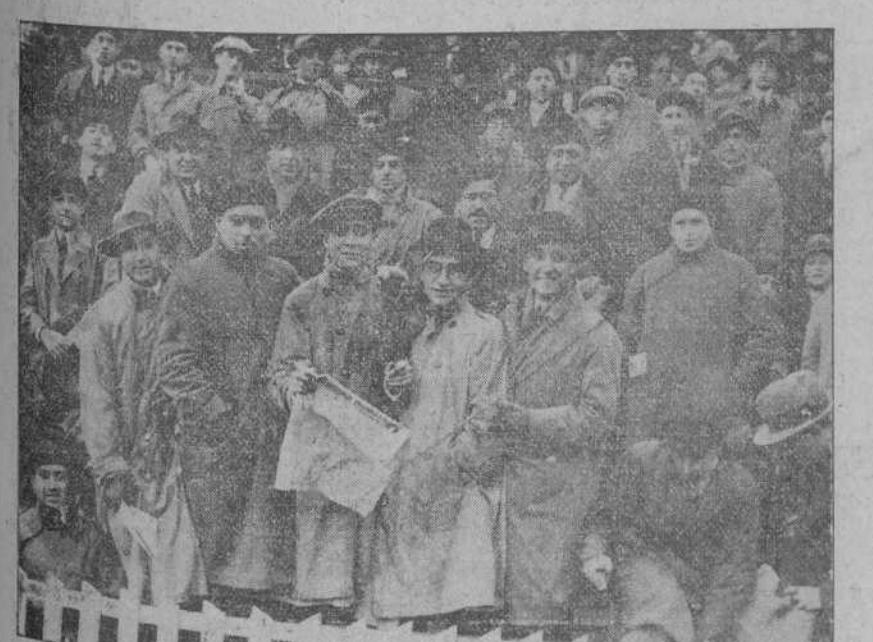
DEL PARTIDO DE AYER EN BILBAO.—Un aspecto de la tribuna, en la que se ve a varios montañeses.

La acostumbrada caricatura. Debido a lo avanzado de la hora en que tuvieron que trabajar ayer nuestros talleres de fotograbado para hacer la interesante y amplia información que publicamos del partido Cataluña-Centro, nos es imposible dar en este número la acostumbrada caricatura de Rivero Gil.