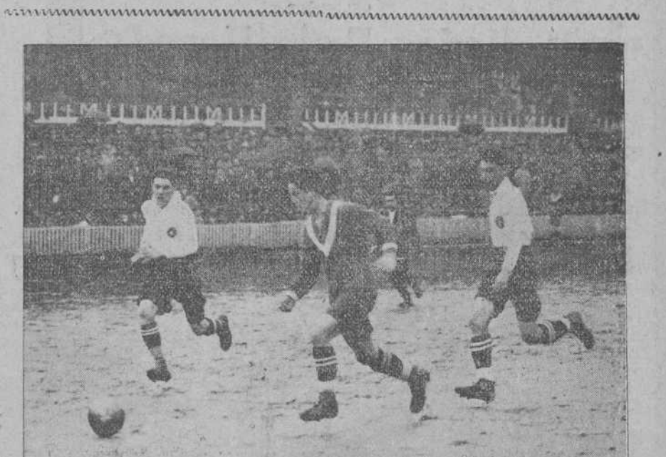
DEL PARTIDO DE AYER EN BILBAO.—Un avance de los madrileños.

TÍN cond años D. contra delito persona se la se le solicita na de accesor petua pesetas ciudad el Juzg a Baldo libre www neros. herido aunque les mo es, de Cubala otro ind os, para lles a stacion ra. al agua que le al primer s, siendo de la Gen os trans onde fue usa en la la región é acosid beneficio ambiente manifest ncia que a delect Lerna. www anos. graves cias. laiza de sanos y os, prom lo. servicio rmando la y los pa ando agre mió parte oto admi xosa no tr ues no tr la deteñ daron a d militar. www ISO. el de ebas. y de Est se man a deter e Tebas omado léstia Est Tamano a Emper oseyó ag www a. del Me rdados tencia de condue ejes, se s antig del Me e suspen el de www S. ilitar. del des de River litares, e go y al y otros