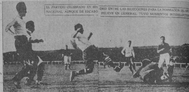
EL PARTIDO CELEBRADO EN MADRID ENTRE LAS SELECCIONES PARA LA FORMACION DEL GRUPO NACIONAL, AUNQUE DE ESCASO RELIEVE EN GENERAL, TUVO MOMENTOS INTERESANTISIMOS.