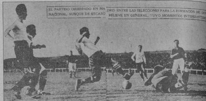
EL PARTIDO CELEBRADO EN MADRID ENTRE LAS SELECCIONES PARA LA FORMACION DEL GRUPO NACIONAL, AUNQUE DE ESCASO RELIEVE EN GENERAL, TUVO MOMENTOS INTERESANTISIMOS.

Teniendo en cuenta estos detalles y reconociendo en ti un tan hábil fotógrafo como certero retocador, al ver la peladada que aquí ha tenido la plana central de la estúpida revista «Aire Libre», en la que el señor Oscar falla una pelota colocada «a posteriori» sobre la fotografía, sin que