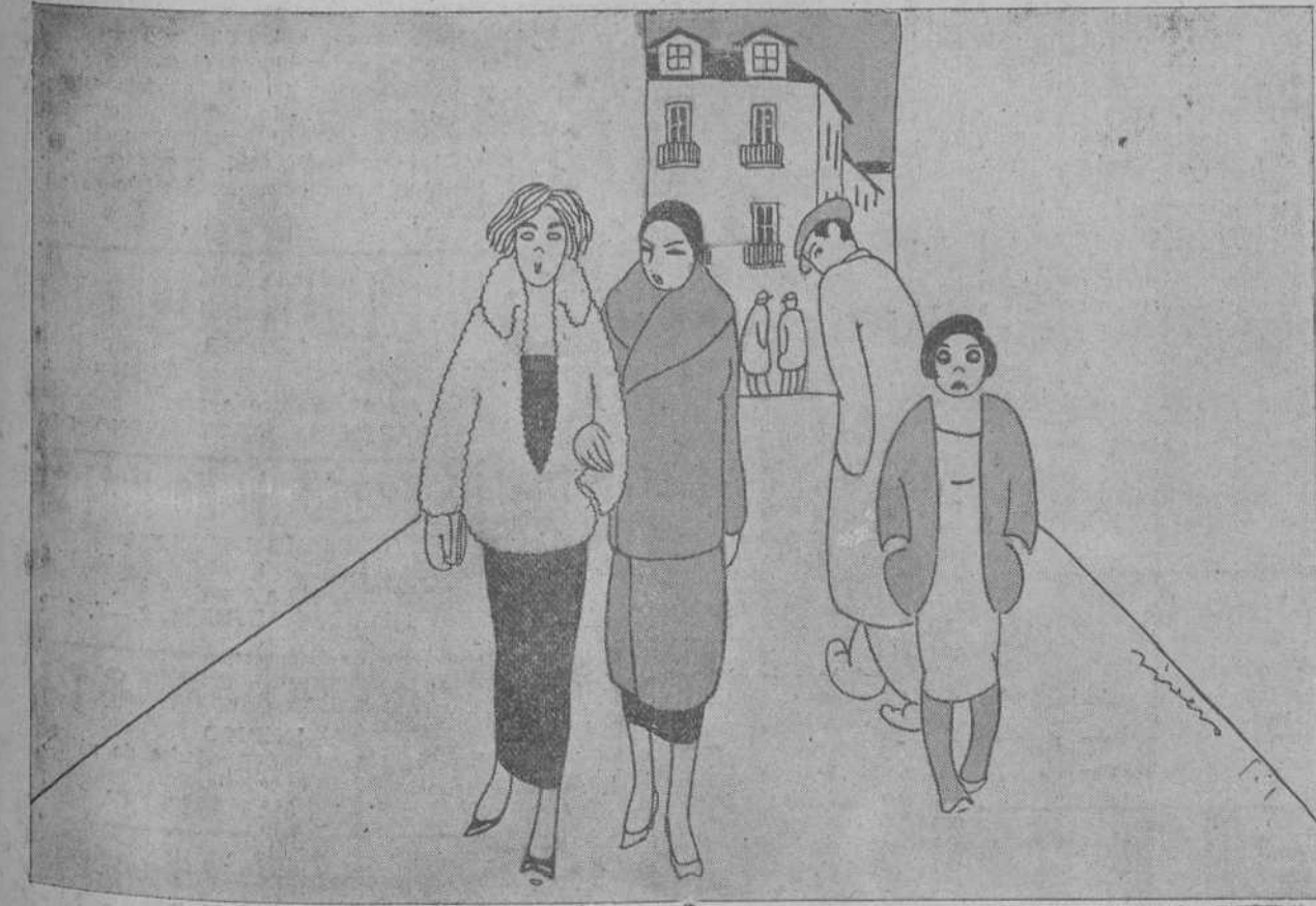
¿Y POR QUE LE DEJASTE? POR INTRANSIGENTE... ES UN HOMBRE QUE «NO SE CASA» CON NADIE.