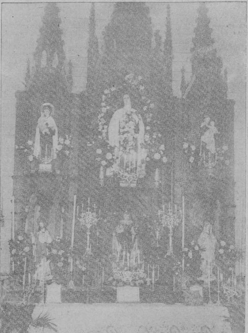
EL PRECIOSO ALTAR DEDICADO A LA BEATA TERESITA DEL NIÑO JESUS, INAUGURADO CON GRAN ESPLENDOR EN LA RESIDENCIA DE LOS PADRES CARMELITAS.

Y se levanta la sesión, a los treinta y cinco minutos de haber dado comienzo.