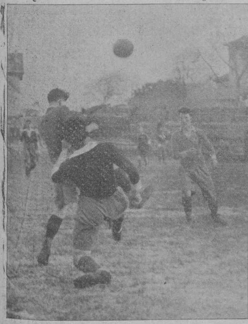
ECLIPSE-UNION DEL ASTILLERO.—Un momento de este partido, celebrado en Miramar.