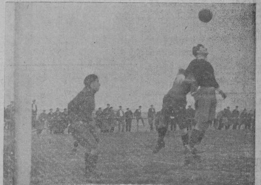
ECLIPSE-UNION CLUB DEL ASTILLERO.—Un defensa corta un avance de Polidura.

de ser un partido de presentación y la de haberse formado a su alrededor una atmósfera de excepcionalidad que seguramente no sería desconocida por el interesado. Y esto ya es bastante a combir un tanto al jugador más tranquilo y más seguro de sí. Sin embargo, a nosotros nos pareció ver en él—puede que nos equivoquemos—madera de excelente jugador: es sereno, practica con mucho conocimiento el juego de pases, hasta el punto de que creemos que con cuatro o cinco partidos más que juegue con el Racing será el Finina del ala izquierda, y tiene la ventaja sobre la casi totalidad de los racinguistas de que sabe que con la cabeza también se juega y la mateja con bastante acierto. A juzgar por lo que el domingo le vimos no es, ni mucho menos, el formidable chutador