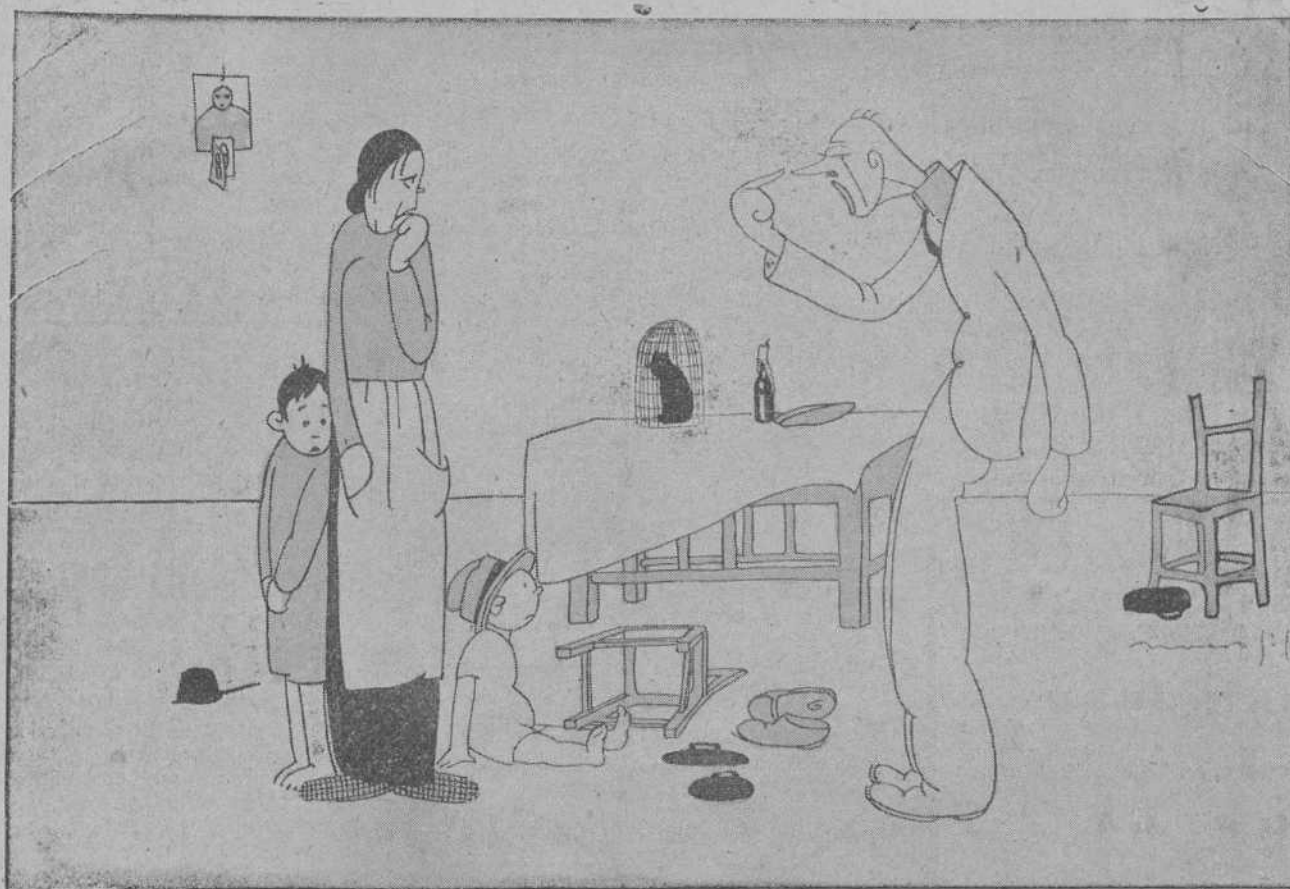
—¿A TI TE PARECE BONITO ESTE DESBARAJUSTE DE CASA? ¡PUES TODO VA A SER HASTA QUE MI SE ME HINCHEN LAS NARICES! ...