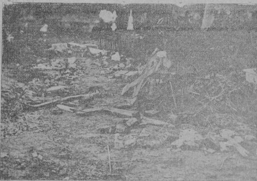
EN EL CEMENTERIO MUNICIPAL DE CIRIEGO.—He aquí una calle que parece la de una ciudad destruida por un terremoto.