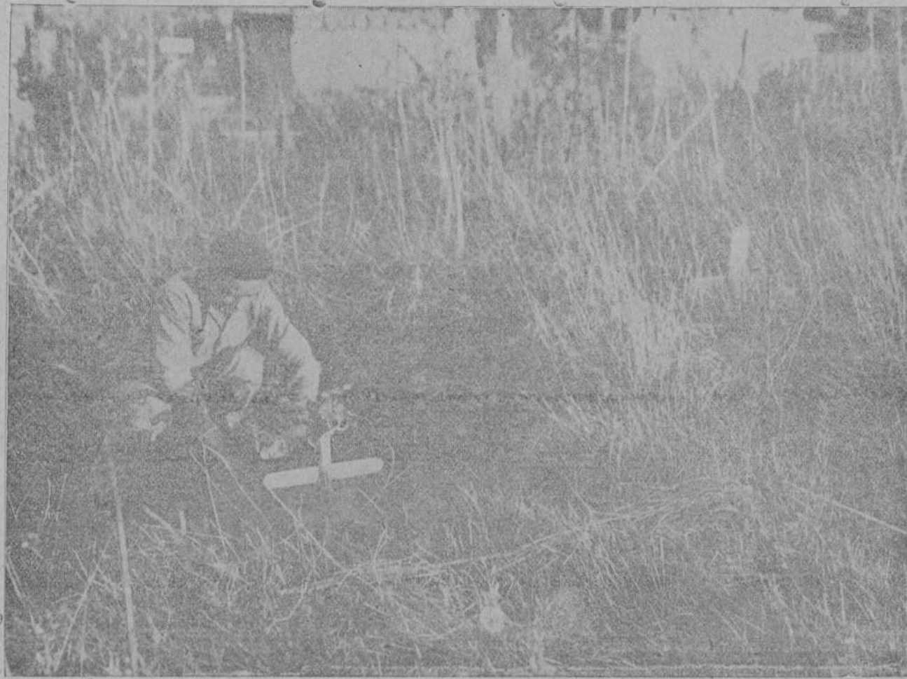
EN EL CEMENTERIO MUNICIPAL DE CIRIEGO.—Entre la maleza encuentra un niño la sepultura de su hermano.

El Ayuntamiento o quien corresponda debe poner inmediatamente manos en el asunto y dejar todo aquello arreglado a la mayor brevedad, por exigirlo así el buen nombre de Santander y la administración pública.