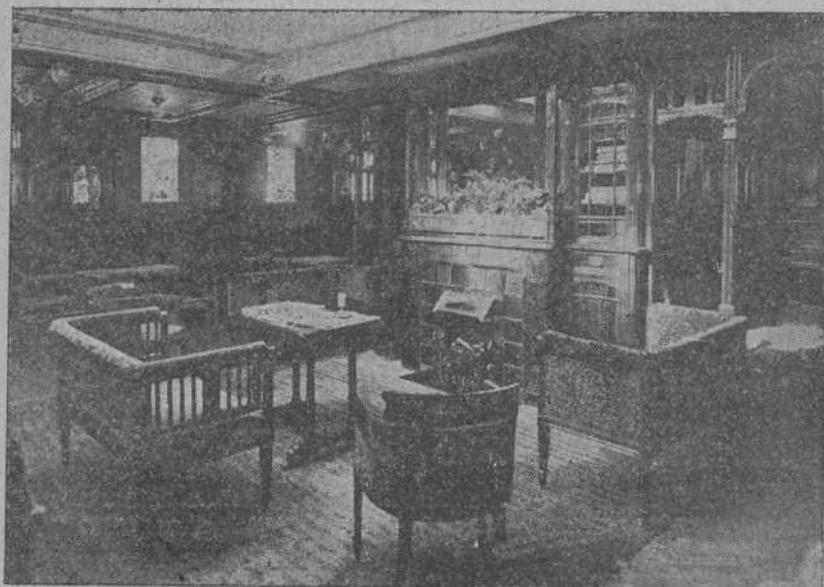
Un detalle del lujoso salón de música del trasatlántico holandés, "Ryndam".

El vapor "Ryndam" saldrá hoy, en viaje extraordinario, para la Habana, Veracruz, Tampico y Nueva Orleans, con más de cien pasajeros recogidos en este puerto y unos cuantos centenares embarcados en los puertos de Rotterdam y de Boulogne, y entre los cuales figura una compañía de comedia italiana y numerosas familias rusas y alemanas.