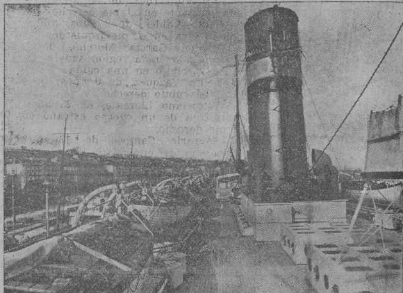
Perspectiva de la toldilla de botes del trasatlántico "Ryndam".