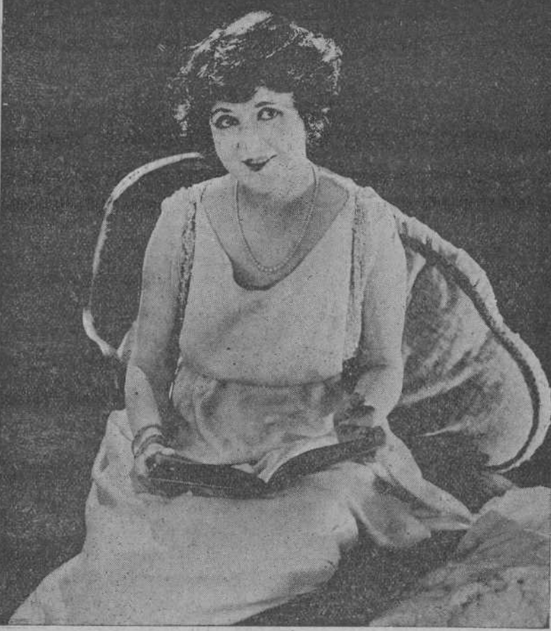
MARGARITA CLARK, BELLA Y NOTABLE ESTRELLA DE LA PANTALLA